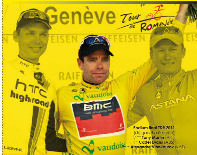
Podium final TDR 2011 (de gauche à droite) 2 ème Tony Martin (ALL) 1 er Cadel Evans (AUS) 3 ème Alexandre Vinokourov (KAZ)

Organisation du TOUR DE ROMANDE - Chassot Concept SA Champ de la Vigne 3 - 1470 Estavayer-le-Lac Tél 026 662 13 49 - Fax 026 662 13 50 - info@tourderomandie.ch