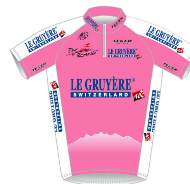
Classement du Grand Prix de la Montagne