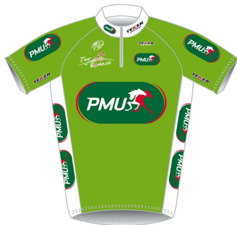
Classement du Meilleur Sprinter