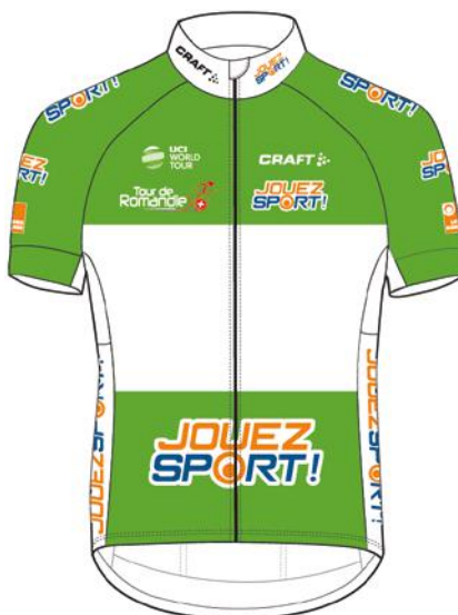
GRÜNES TRIKOT BESTER SPRINTER Jouez Sport