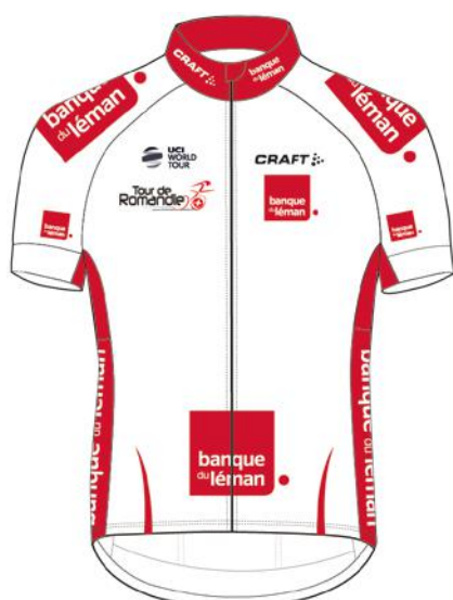
WEISSES TRIKOT BESTER NACHWUCHSFAHRER Banque du Léman