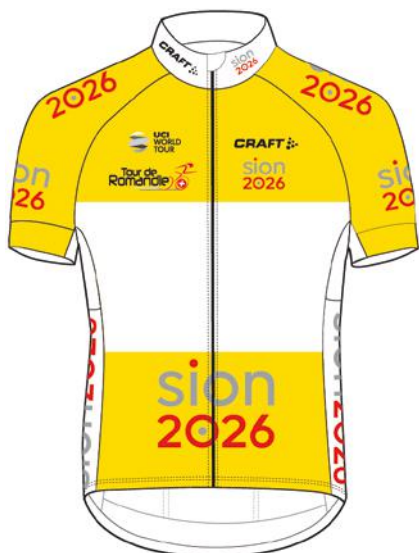
GELBES TRIKOT DU MEILLEUR DU CLASSEMENT GÉNÉRAL Sion 2026