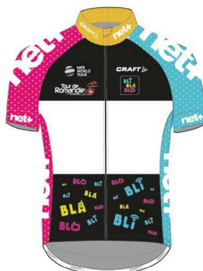
DREIFARBIGES TRIKOT BESTER BERGFAHRER NET+